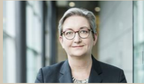
Bundesministerin Klara Geywitz