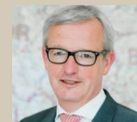
Guido Beermann Minister für Infrastruktur und Landesplanung Brandenburg