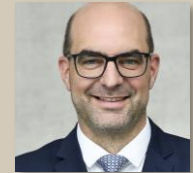
Michael Kießling CDU/CSU Bundestagsfraktion, fachpolitischer Sprecher CSU für Bauwesen