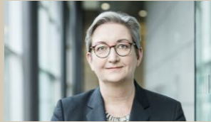
Bundesministerin Klara Geywitz